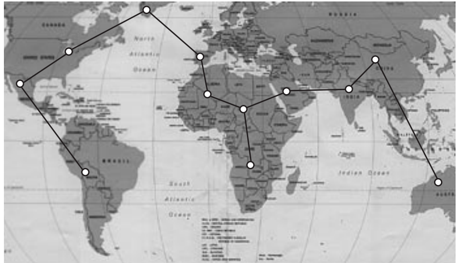
Weltweiter Verbund solarthermischer Kraftwerke. Über Hochspannungs-Gleichstrom-Leitungen wird der Strom weiter geleitet.

bundes könnte der CO 2 -Ausstoß aus der Verbrennung fossiler Brennstoffe in den kommenden Jahren um 60 bis 80 Prozent reduziert werden.