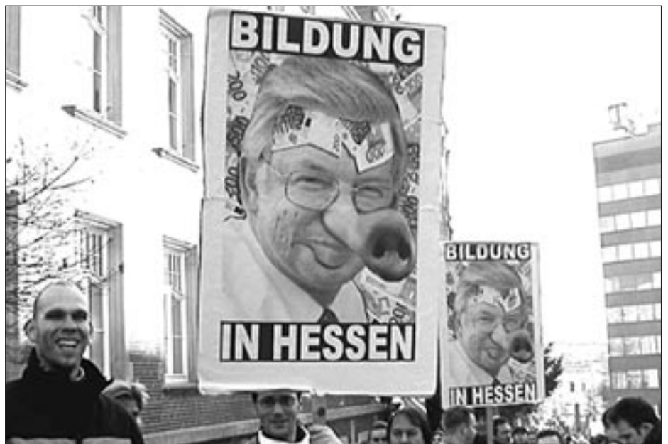
Studentendemo Ende November '03 in Kassel

längeres Studium sind und die Gebühren vor allem solche Studierende treffen, die neben dem Studium Geld verdienen müssen. Vorgeschoben, weil