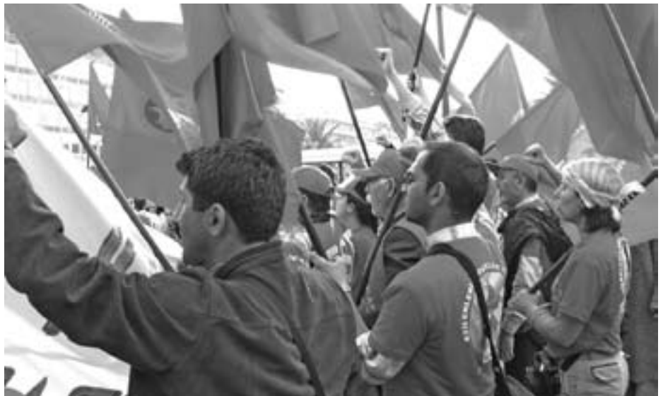
Großkundgebung in Athen am 6.5.06 anlässlich des 4. Europäischen Sozialforums, bei der die Jugend das Bild prägte.

Wir als Griechenlandurlauber nutzten die Gelegenheit, den Protest der Studenten zu unterstützen. Unsere Sandwiches, in denen wir unsere Solidarität erklärten, stiessen auf großes Interesse. Eine Teilnehmerin bedankte sich: „Thank you for your support!“ Nach den Semesterferien wollen die Studenten mit frischer Kraft weitermachen.