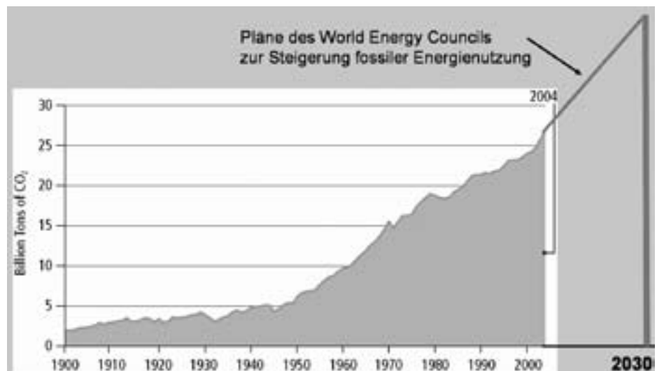
Entwicklung der CO 2 Emissionen durch Verbrennung fossiler Energieträger in den letzten 100 Jahren. Nach den Plänen des World Energy Councils (dem Zusammenschluss der größten Ölkonzerne), sollen die Emissionen bis 2030 um mehr als 50% gesteigert werden. Quellen: World Resources Institute, Navigating Numbers, 2005 und Internationale Energieagentur, Key World Statistics, 2005.

tal. Am Tage als Gore als US Vize für die USA das Protokoll unterzeichnete, sagte er: „Die Unterzeichnung des Protokolls ist ein wichtiger Schritt vorwärts, bedeutet jedoch für die USA keinerlei Verpflichtung. Das Protokoll wird erst nach einer Verabschiedung im US Senat bindend. Wie wir zuvor schon sagten, werden wir das Protokoll nicht zur Ratifizierung einreichen, ohne einen bedeutsamen Beitrag entscheidender Entwicklungsländer zum Klimaschutz“ (zit. nach der US Zeitung Revolution, 16. Juli). In anderen Worten, Gore verlangte, dass erst die abhängigen, armen Entwicklungsländer handeln müssen, bevor superreiche Großverursacher, wie die USA überhaupt nur daran denken, zu unterzeichnen. Tatsächlich hat Al Gore das Protokoll nicht in den US Senat eingebracht, als er noch die Möglichkeiten dazu hatte.