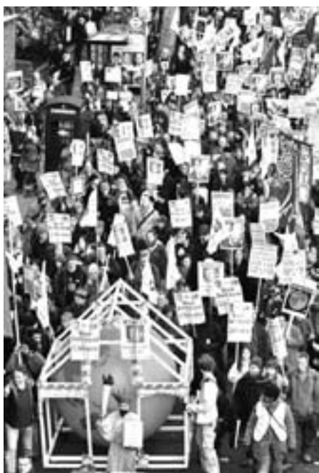
2005: Massenproteste in London gegen die Politik der Klimazerstörung durch die Blair-Regierung.

Zu den positiven Aspekten des Films gehört es, dass Gore sich mit den so genannten Klimaskeptikern auseinan-